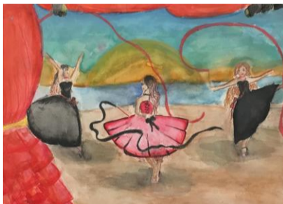
Pun Pun G.6